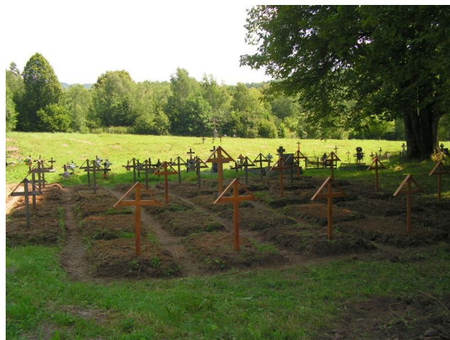
Вид после окончания всех работ