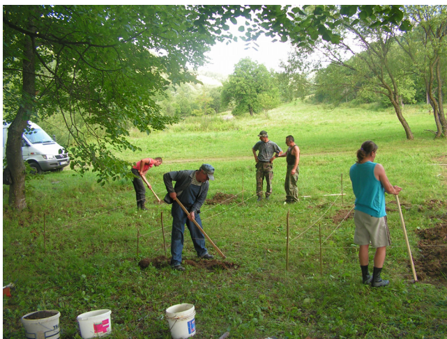
Начало работ по восстановлению захоронений

http://www.kvhbeskydy.sk/index.php/2010/09/23/vojnovy-cintorin-z-prvej-svetovej-vojny-v-obci-zvala/