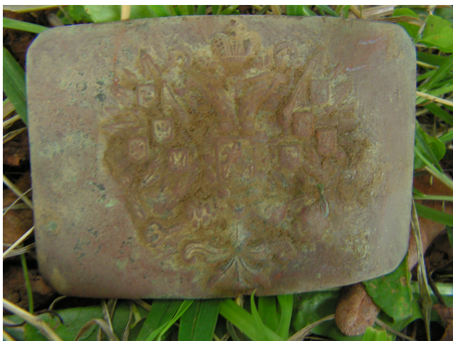
Находка – ременная пряжка погибшего солдата Русской Императорской Армии